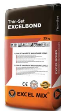
lepicí malta pro obkladové pásy