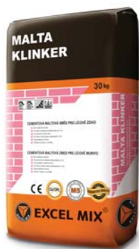
zdicí malta pro cihly Terca Klinker tažené