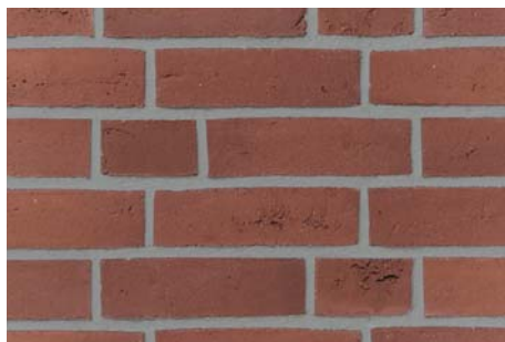
Použití spárovací malty – ŠEDÁ

Příklad použití různých odstínů spárovací malty u stejného typu obkladového raženého pásku Terca: