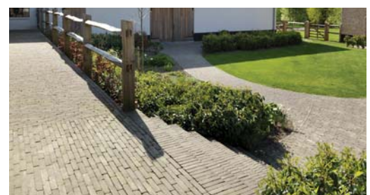
Ukázky realizací s použitím cihlové dlažby Penter.