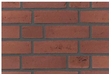
Použití spárovací malty – ANTRACIT