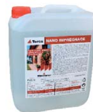
balení impregnace v kanystru