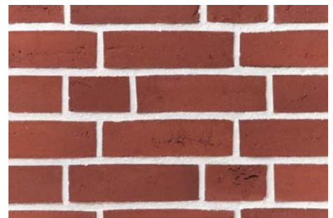
Použití spárovací malty – BÍLÁ