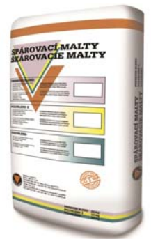
spárovací malta pro obkladové pásy