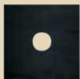
Těsnicí manžeta pro těsnění prostupových komínků průměr 100–120 mm (500 x 500 mm)

Základní taška, která s doplňky (nástavec pro odvětrání kanalizace – sada, nástavec pro anténu) tvoří keramický komplet esteticky zapadající do rázu střechy.