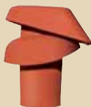
Nástavec pro odvětrání kanalizace